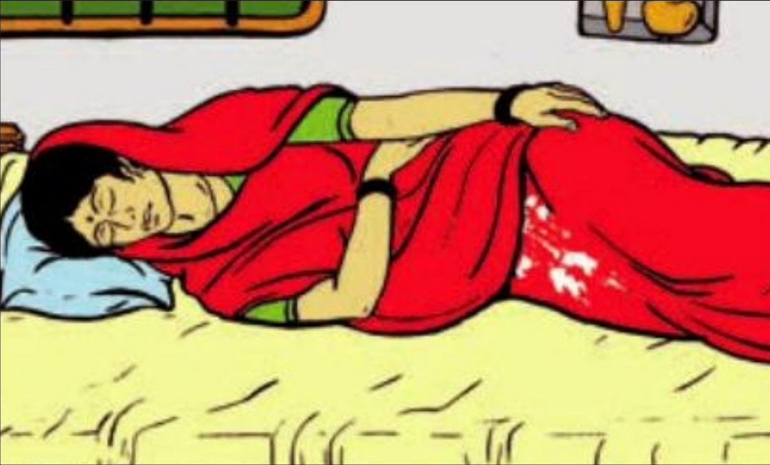
પ્રસવ પીડા વગર પાણી પડવું