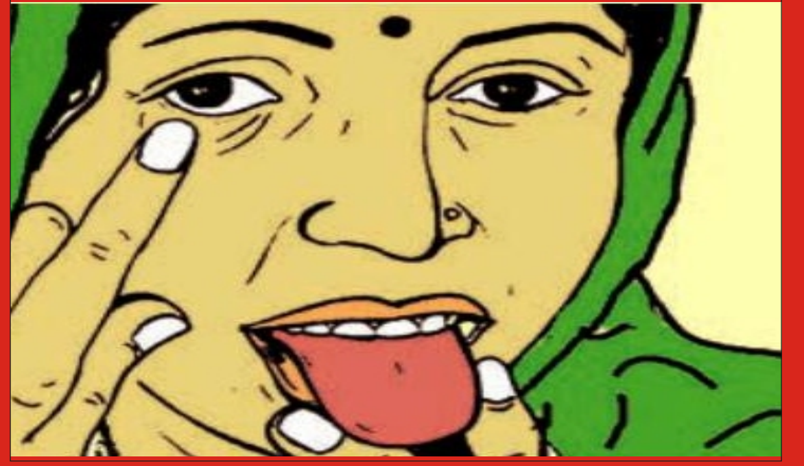
જીભ, નખ, આંખ ફીકી પડી જવી (એનીમિયા)