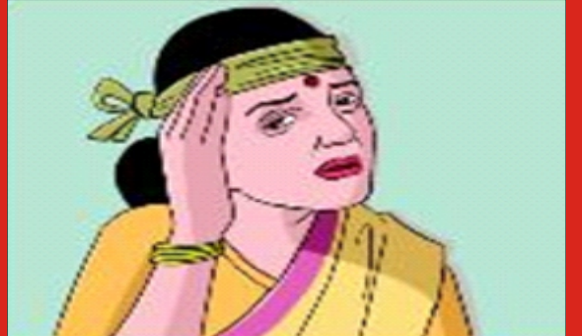
સુવાવડમાં માથું દુઃખવું

ઉપર બતાવેલ કોઈ પણ જોખમી ચિન્હો જણાતા તરત જ આશા કે નર્સબેનનો સંપર્ક કરવો અને નજીકના કોઈ પણ આરોગ્ય કેન્દ્ર પર સારવાર લેવી દરેક સગર્ભામાતાએ પ્રસૂતિ બાદ બે કે ત્રણ દિવસ સુધી હોસ્પિટલમાં રહેવું અત્યંત જરૂરી છે કારણ કે આ સમયમાં કોઈપણ જોખમ હોય તો વહેલી તકે ઓળખીને તાત્કાલિક સારવાર મળે છે અને પ્રસૂતિ બાદ થતા માતા મરણ અટકાવી શકાય છે.