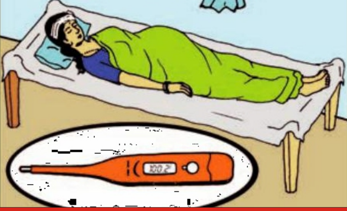
સગર્ભાવસ્થા દરમ્યાન તાવ આવે

સગર્ભાની સંભાળ લઈ જોખમો પર મેળવીએ કાબુ સ્વસ્થ માતા અને બાળકનું જીવન બને લાંબુ